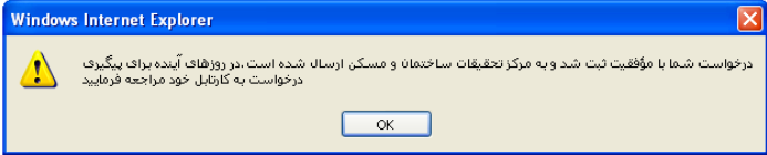
شکل ۱۰- پیام تأیید ثبت درخواست صدور گواهینامه فنی

۷- ثبت مشخصات تکمیلی متقاضی و محصول: در این قسمت لازم است مشخصات متقاضی و محصول در دو فرم متوالی تکمیل و ارسال شود. پس از تکمیل مشخصات خواسته شده در هر فرم و ارسال آن پیام نشان داده شده در شکل ۱۰ نمایش داده می شود.