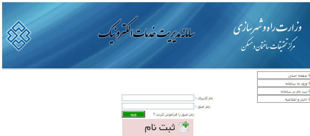
شکل ۵ - منوی ورود به سامانه

۴- ورود به سامانه: پس از انتخاب گزینه "ورود به سامانه" از منوی سمت چپ (شکل ۵)، و درج نام کاربری و رمز عبور وارد صفحه اصلی سامانه می‌شوید (شکل ۶).