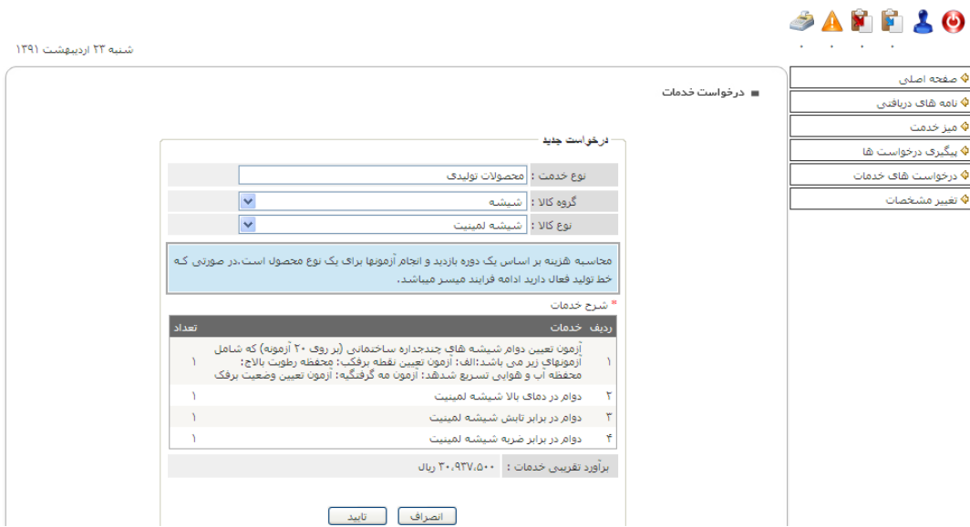
شکل ۹- ثبت محصول و برآورد هزینه تقریبی خدمات قبل از صدور گواهینامه فنی

۷- ثبت مشخصات تکمیلی متقاضی و محصول: در این قسمت لازم است مشخصات متقاضی و محصول در دو فرم متوالی تکمیل و ارسال شود. پس از تکمیل مشخصات خواسته شده در هر فرم و ارسال آن پیام نشان داده شده در شکل ۱۰ نمایش داده می شود.