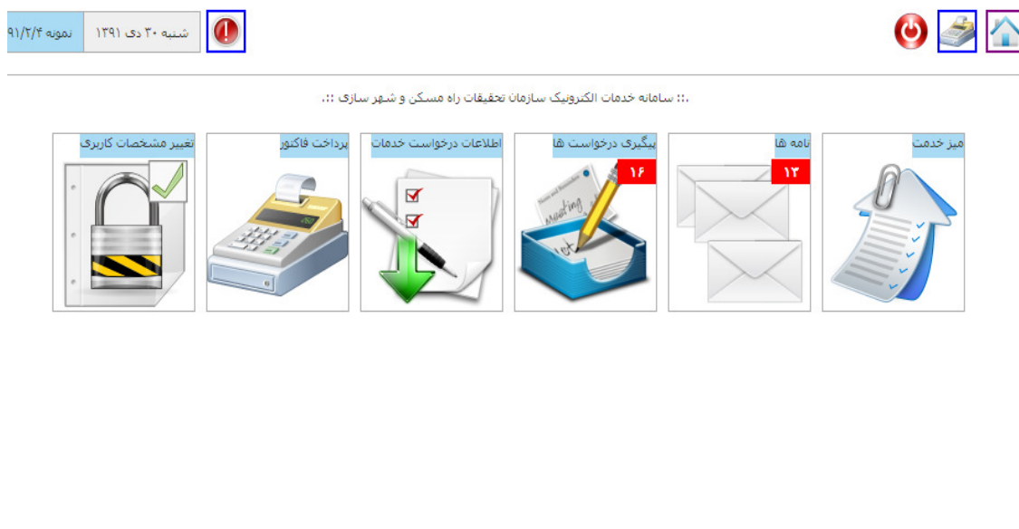
شکل ۶ - صفحه اصلی سامانه